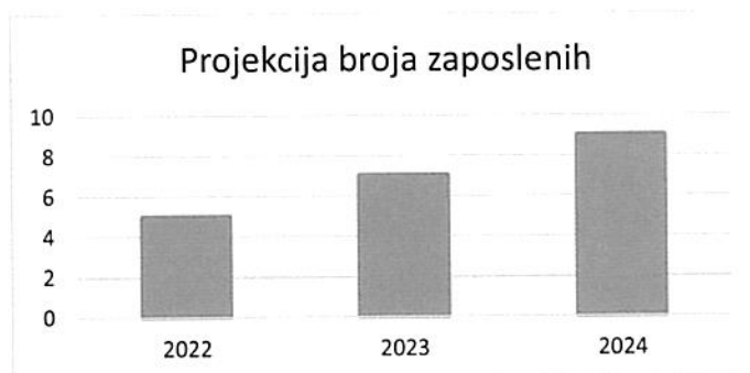
Grafički prikaz: Plan kretanja broja zaposlenih po godinama

Sukladno navedenim podacima vidljivo je kako je dužnik od 31.12.2021. pa do trenutka predaje predstečajne dokumentacije zbog trenutno ekonomske situacije unutar društva bio primoran otpustiti 4 djelatnika, no nastojat će u što kraćem roku nadomjestiti broj otpuštenih radnika. Dužnik želi istaknuti kako na dan predaje predstečajne dokumentacije ima sigurna radna mjesta koja nisu ugrožena te u periodu restrukturiranja će nastojat zapošljavati i dalje ovisno o potrebama posla koji se obavlja.